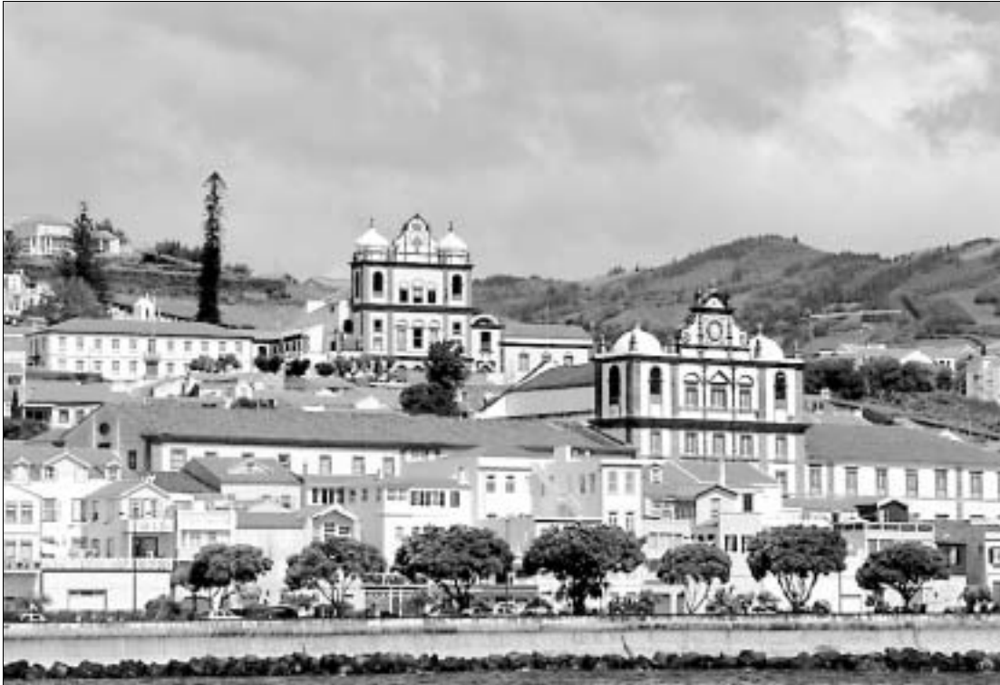
Horta, eine Perle der Azoren