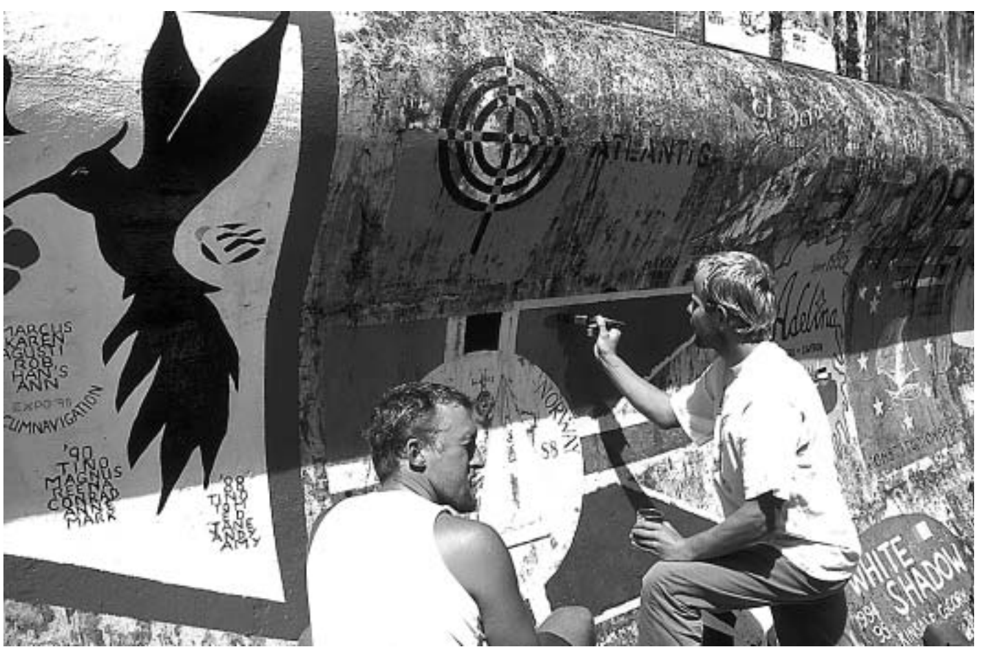
An der Kaimauer von Horta verewigen sich die Atlantiküberquerer