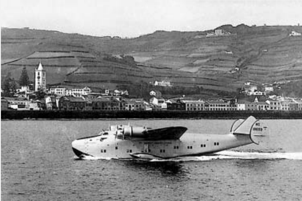
Das waren noch Zeiten ... (um 1930)

Flugboot Dornier Wal , auch unter dem Namen DO-X bekannt, das damals größte Wasserflugzeug der Welt, in dem über 70 Passagiere Platz fanden. 1930 tauchte ein Zeppelin am Horizont auf, 1933 landeten 24 Savoia Marchetti -Flugboote auf dem Rückflug von der Weltausstellung in Chicago nach Rom in Horta zwischen. Wenige Tage später sollen es auch ein paar UFOs probiert haben. Augenzeugen zufolge – betrunkene amerikanische Walfänger – gingen sie jedoch kurz darauf unter.