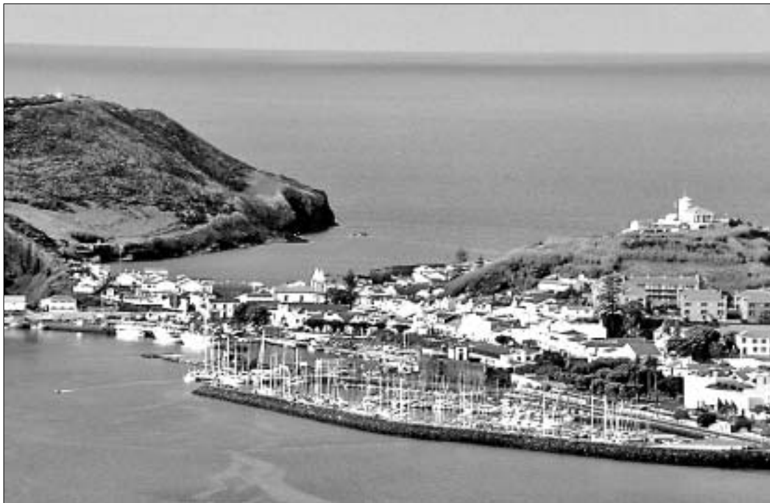
Blick auf Horta vom Monte da Espalamaca