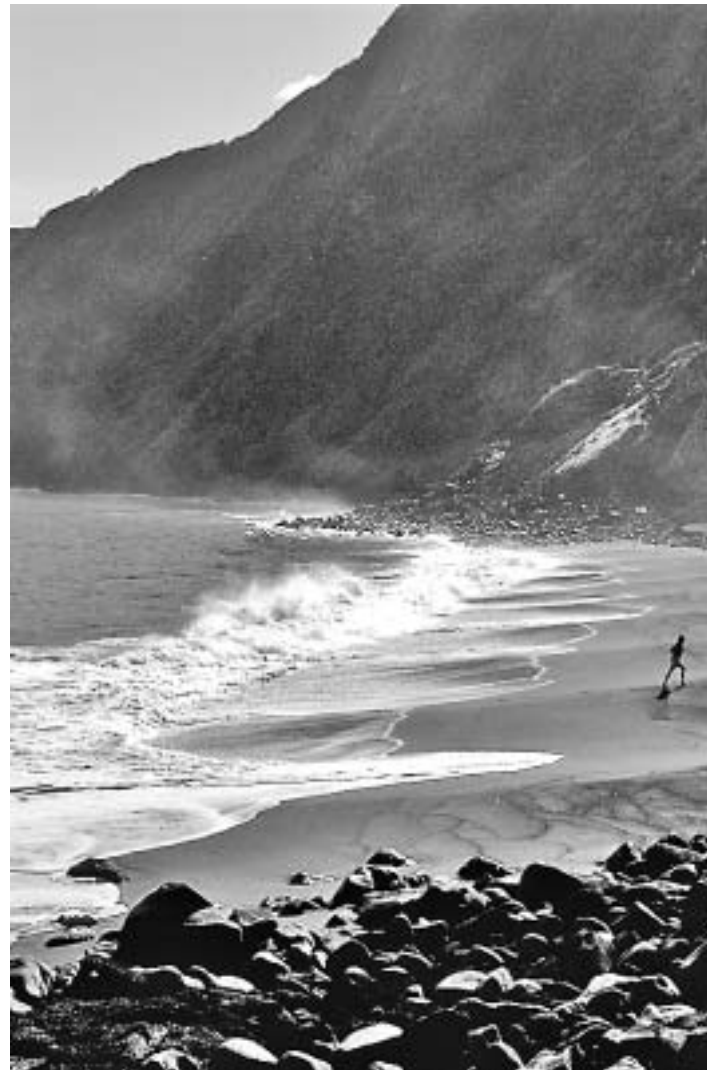
Baía da Ribeira das Cabras

Von Mitte Sept. bis Mitte Juni fährt Mi ein Schiff von Horta über Pico (Madalena) nach São Jorge (Velas), Fr/So zudem 1-mal (von Mitte Mai bis Mitte Juni Fr/So 2-mal) ein Schiff von Horta über Pico (zuerst Madalena, dann Cais do Pico) nach São Jorge (Velas).